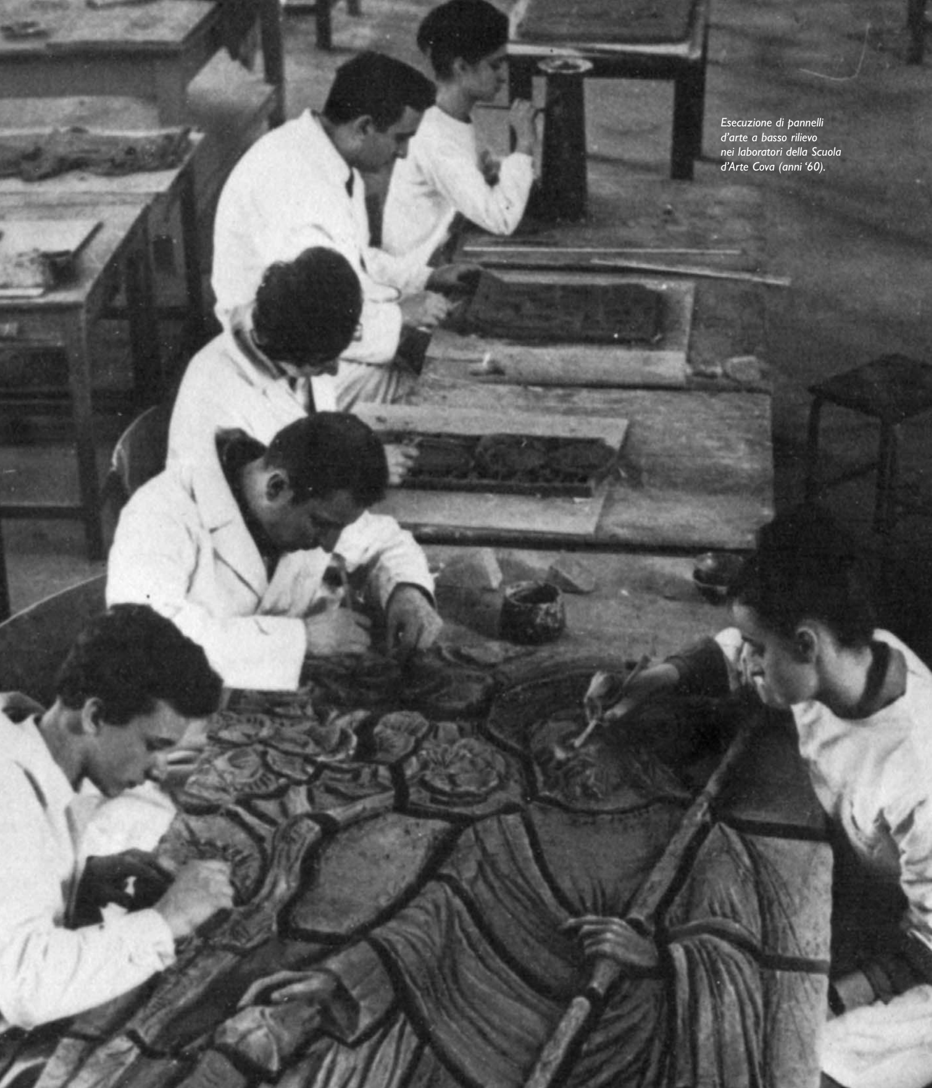
Esecuzione di pannelli d'arte a basso rilievo nei laboratori della Scuola d'Arte Cova (anni '60).